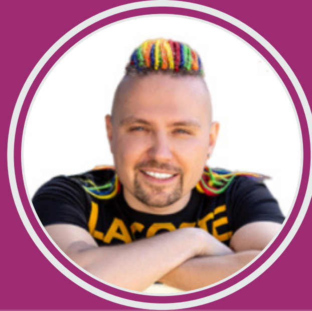
ШКОЛА BEST YOUTUBERS

Создатель полезного блога по технике @katenin_device, гид по гаджетам